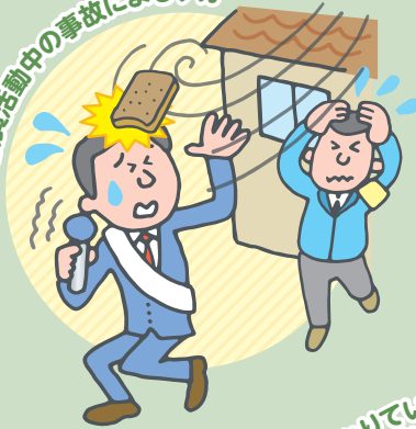
議員活動中の事故によるケガ