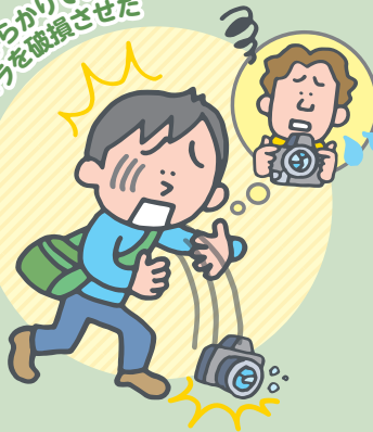
友人からかりている カメラを破損させた