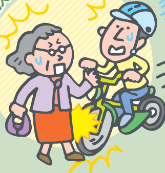
自転車で他人にケガを負わせた