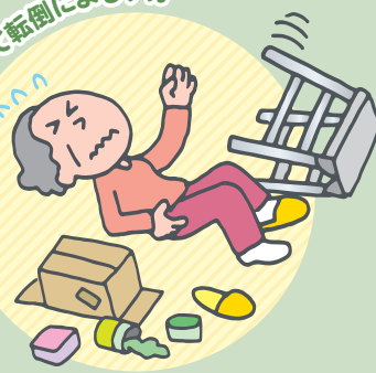
自宅で誤って転倒によるケガ