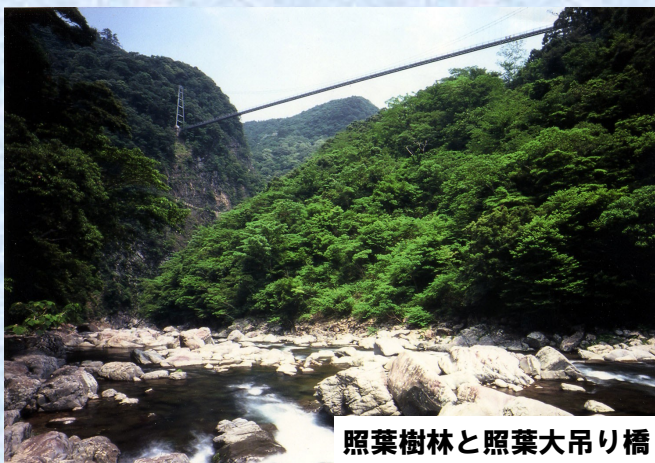
照葉樹林と照葉大吊り橋

日時 2015年6月24日（水）13:00～6月26日（金）12:00 （裏面に予定カリキュラムを掲載しています）