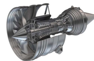
耐熱合金を用いる航空機エンジン