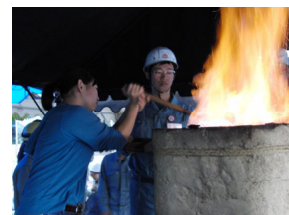
たたら操業実習(島根大)