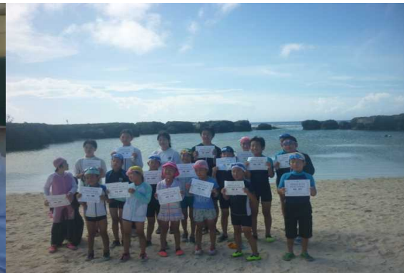
宝島 十島村山海留学