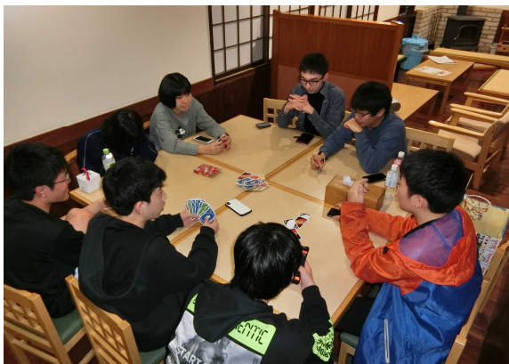
礼文島 礼文高校魅力化プロジェクト