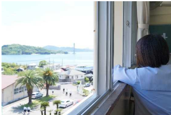
弓削島 弓削高等学校生徒全国募集