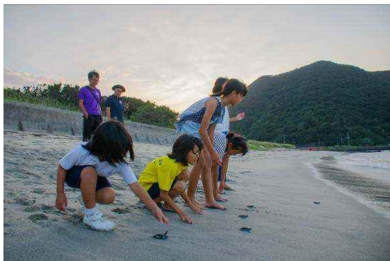
屋久島 ウミガメ放流