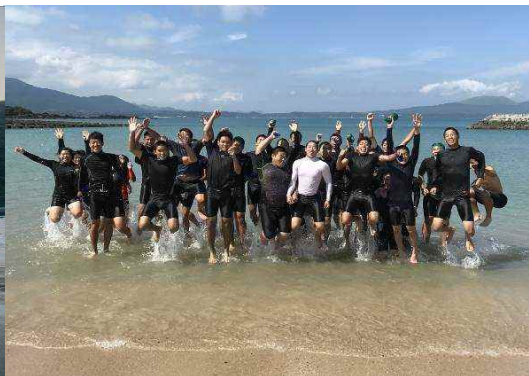
五島高等学校 遠泳