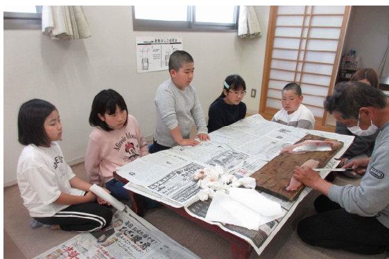
宗像市 魚さばき体験