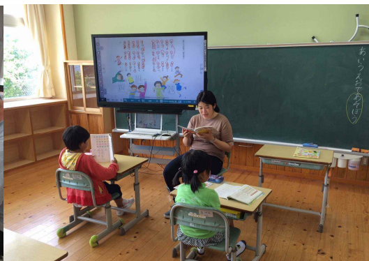
からつの島留学 授業風景