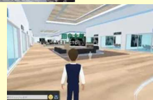
メタバースの活用