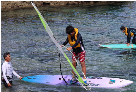
ウインドサーフィン体験（宝島）