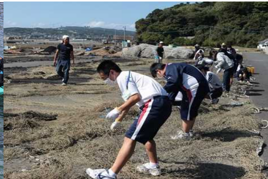
魚網体験の様子（福江島）