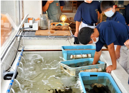
水槽で生き物観察する様子（答志島）