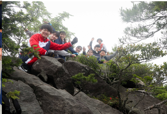
校外活動の様子（隠岐の島）