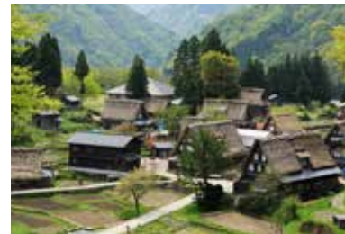
世界遺産 相倉合掌造り集落